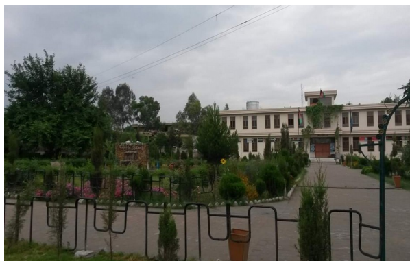
L'école de Djalalabad